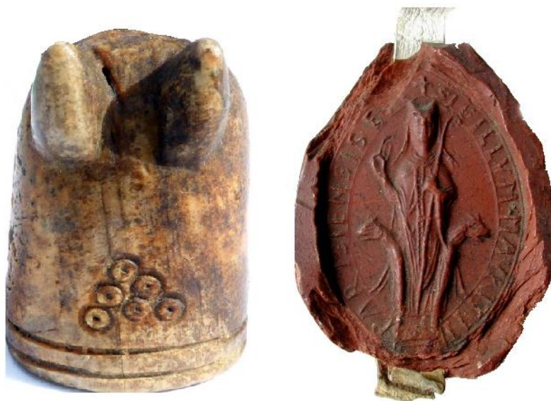
Figura słonia XII-XIII w. Anglia- Wannigforth i pieczęć biskupa francuskiego Maurca de Sully z XII w.

Biskup został wprowadzony na europejską szachownicę w XII wieku, zastępując słonia tradycji islamskiej i za pierwsze przedstawienia tego typu uznaje się serię bierok ze słynnej wyspy Lewis. Na południu Europy głównie we Francji i Hiszpanii, dwa „rogi” skojarzyły się nie z mitrą duchownego tylko z czapką błazna. I tam tak właśnie był nazywany dzisiejszy goniec - „le Fou”.